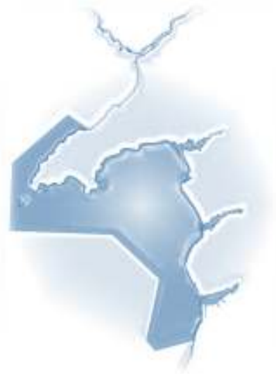
Ffigwr 1: Map ACA PLAS

Oherwydd y tirweddau tanddwr amryfal ac anghyffredin, y mathau o gynefin a'r anifeiliaid a'r planhigion anhygoel sy'n byw yn yr ardal, mae'r arfordir a'r môr o amgylch penrhyn Llŷn a gogledd Bae Ceredigion wedi ei warchod fel Ardal Cadwraeth Arbennig Pen Llŷn a'r Sarnau (ACA PLAS) - safle cadwraeth bywyd gwyllt sydd wedi ennill ei ddynodiad fel un o'r ardaloedd bywyd gwyllt gorau yn Ewrop (gwneir y dynodiad ACA dan Gyfarwyddeb Cynefinoedd y GE sy'n helpu i weithredu targedau a gytunwyd yn fyd-eang i helpu atal colli bioamrywiaeth). Mae'r ACA mawr hwn yn cynnwys penrhyn Llŷn i'r gogledd, Bae Tremadog a riffiau'r Sarnau yn yr hanner deheuol yn ogystal ag aberoedd mawr ar hyd arfordir Meirionnydd a gogledd Ceredigion.