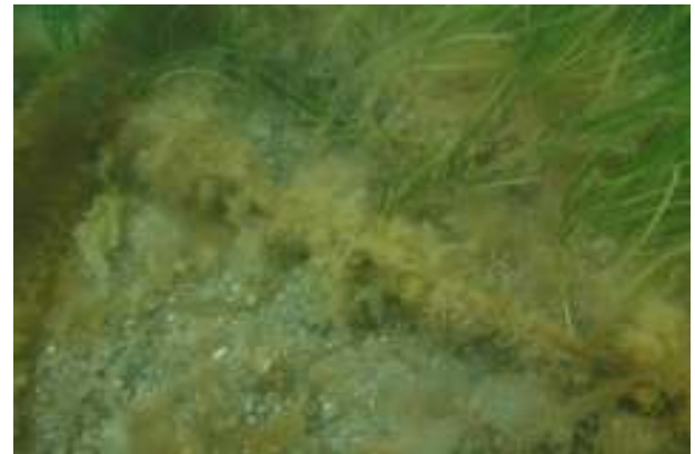
Ffigwr 3: Ardrawiad cadwyn angori yn sgwrio gwely morwellt Porthdinllaen

Yn ogystal â cholli canran o'r morwellt, mae'r rhannau moel yn darnio'r gwely morwellt ac mae'n mynd yn dameidiog ac nid yw'n wely di-dor erbyn hyn. Mae gwelyau tameidiog yn fwy agored i effaith erydiad ac yn fwy agored i gael eu mygu gan dywod rhydd gan nad yw llawer o'r tywod o gwmpas yn cael ei gadw yn ei le gan rwydwaith gwreiddiau'r planhigion morwellt. Gall hyn fynd yn fwy o broblem os byddwn yn cael mwy o dywydd stormus a gall arwain at golli mwy o'r gwely morwellt.