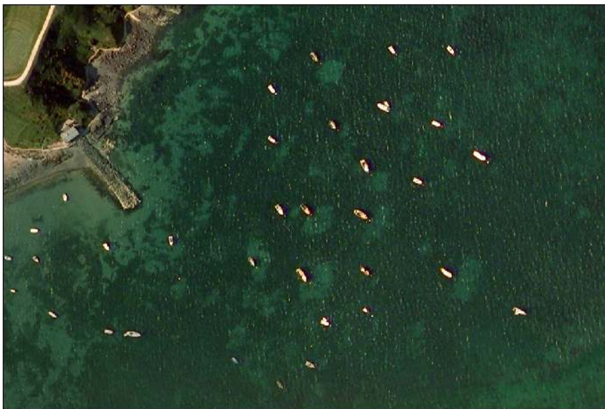
Ffigwr 1: Cylchoedd o greithiau i'w gweld o gwmpas angorfeydd sefydlog traddodiadol mewn llun o'r awyr o Borthdinllaen.

Drwy ddelweddau a dynnwyd o'r awyr ac arolygon tanddwr, rydym wedi cychwyn deall ehangder y gwely morwellt ym Mhorthdinllaen a bod rhannau o'r gwely o ansawdd uchel gyda thyfiant trwchus o blanhigion y morwellt (gweler Ffigwr 1). Fodd bynnag, mae'r un wybodaeth ac arolygon wedi dangos bod yr angorfeydd ym Mhorthdinllaen yn cael effaith ar y gwely morwellt. Mae'r cadwynau angori yn ysgubo ar draws y gwely morwellt efo'r gwynt, y llanw ac ymchwydd y tonnau gan arwain at godi a dadwreiddio'r morwellt a gadael cylchoedd o fylchau mawr yng ngwely'r morwellt. Gweler Ffigyrau 2 a 3.