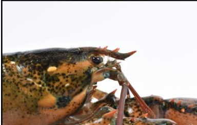
Llun o gimwch Americanaidd

Mae rhywogaethau goresgynnol estron (INNS) yn blanhigion ac anifeiliaid nad ydynt yn bodoli'n naturiol yn yr ardal ond sydd wedi'u symud yma, yn bennaf drwy weithgareddau dynol, ac sy'n achosi difrod sylweddol. Maent yn cystadlu'n well na rhywogaethau cynhenid, yn cyflwyno clefydau ac amcangyfrifir eu bod yn costio oddeutu £1.7 biliwn i economi Prydain bob blwyddyn. Mae INNS morol yn cyrraedd drwy amrywiaeth o 'lwybrau' gan gynnwys dŵr balast, glynu ar gyrff/cyfarpar llongau, cael eu cario gyda stoc dyframaeth, gweithgareddau megis hwylio hamdden, cludo ar longau, gweithgareddau pysgota, abwyd byw, dyframaeth a thwristiaeth. Mae biaddiogelwch yn golygu gweithredu camau syml i'w hatal rhag cael eu cyflwyno a'u lledaenu. Mae llawer yn haws eu hatal rhag cyrraedd yn y lle cyntaf na chael gwared â nhw wedi iddynt gyrraedd, yn enwedig mewn amgylchedd morol. Mae cynllun biaddiogelwch PLAS yn canolbwyntio ar y pethau y gallwn eu gwneud i leihau'r risg o gyflwyno a lledaenu INNS morol.